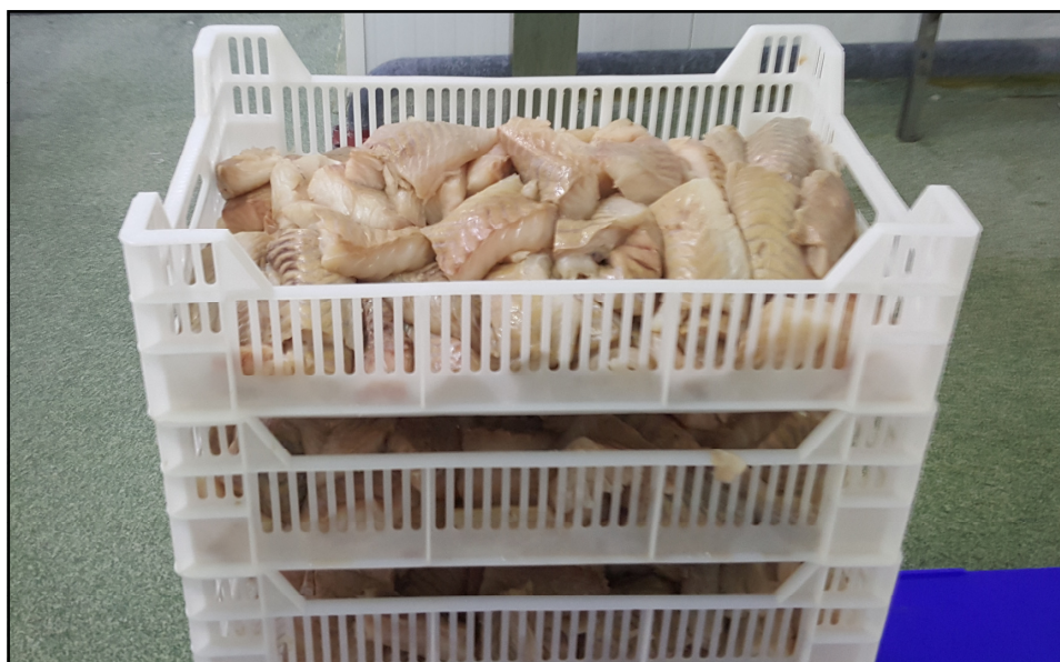
Trålfisk, mente denne var fersk