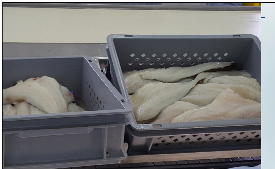
Sjøfryst linefisk. Fisk kastet ut pga feil til venstre.