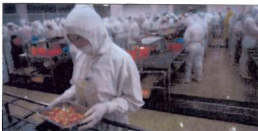
DÅRLIG: Industrien i Qingdao har følgelig hatt lav lønnsomhet.

– Den statlige garantiordningen har vært helt nødvendig for å komme i mål i 2013, og den vil trenge også i 2014.