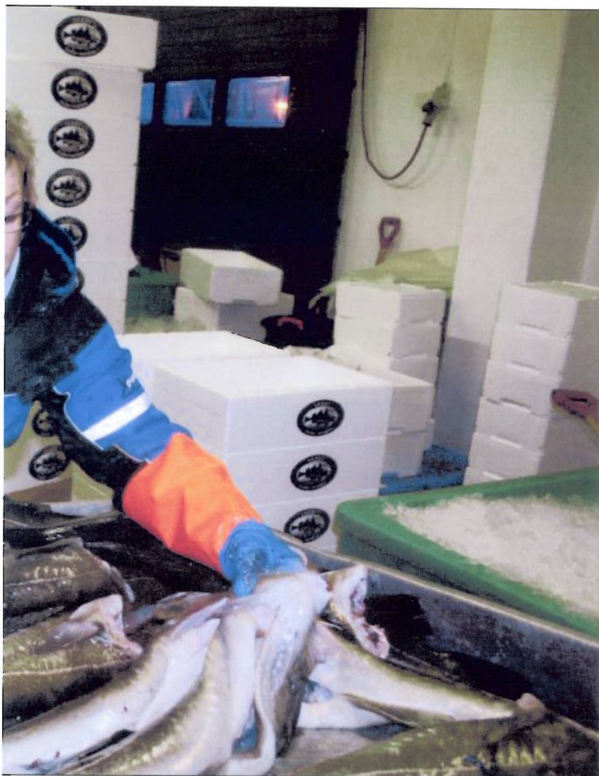
er Geir Rognan.