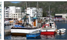
LANGVEISFARENDE: «Ternholm» (ved kai) fra Vesterøy i Østfjord har vært sentralt i de få de et utvalg som har drevet notfiske med base i Svolvear i sommer. Mandag ble 10 tonn makrell levert på Værøy.

sen på makrellen og dermed prisen. Her får vi over 500 grams makrell, hjemme ligger den på 300 gram, det skal ganske mye ut på sluttresultatet for oss, og dermed blir vi så lenge det er fangstmuligheter i området, sier Nygård. 7.600 smitt