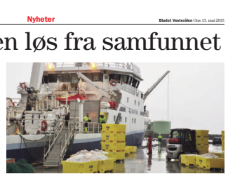
Hvorfor problematiserer ikke Tveteråsutvalget at et eventuelt integrert arbeid som Akers har gjort opp sin utgangspunkt for? (Kystfiskarlaget)

- Forkastelig Kystfiskarlaget mener fiskeripolitikken både skal forvalte fiskeressursene og det samfunnsbærende