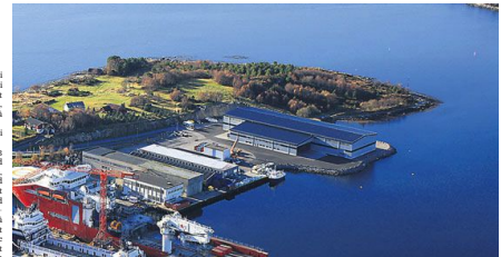
WITEN Mørenot hadde kjøpt av for fiskeutstyret som sakk. Følgje dommen i Frostating lagmannsstem. <small>...</small>

Reiaren stevna Mørenot til opp. Det var ikkje teken til