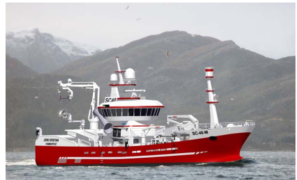
KLAR I 2018: Under utviklingen av M/S «Jens Kristian» har det ikke vært spart på noe. Den skal være best i sin klasse. TOSMØ, SEACON AS

MANDAG 11. JULI 2016 FISKERIBLADET/FISKAREN