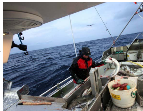
SKJERMER: Fjordlinjene skal skjerme den minste kystflåten og ressursgrunnlaget deres. Nå skal FHF forske på om det er god butikk for samtlige Johnsen på torskefiske.

– Ifølge nemndens oppdragsheter har vi penger nok til å gjøre jobben vår, og vi føler oss ikke på noen måte begrenset av de økonomiske rammen.