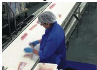
Herfor er det viktig å se på fiskeriministerens varsel om en mulig innstramning av leveringsordningen for trålerne, slik at den får et reelt pliktinnhold. Dette vil helt sikkert bedre råstofftilførselen til enkelte filetbedrifter. Om det bidrar til å løse de økonomiske vanskene i filetindustrien, er mer tvisomt.