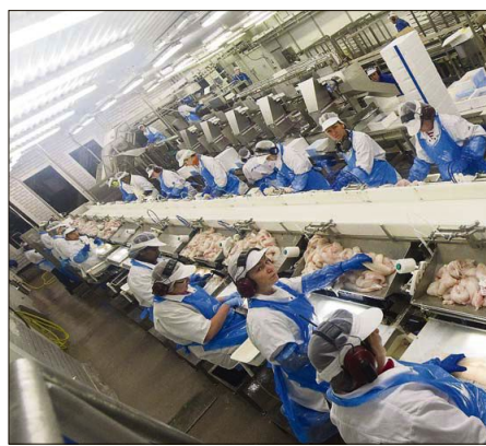
IKRISSE: Ifølge forskere er det flere drakter av fiskeindustrien ellers, blant annet sterk konkurranse, bortfall av subsidier, utbygging av leveringsplikt og en høy norsk kostnadsnivå.