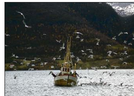
Fiskeforedling har vært basering og leveringsforpliktelsen økonomisk og sosialt med stadig økende krav til effektivitet, kvalitet, dokumentasjon og leveringsforpliktelse.