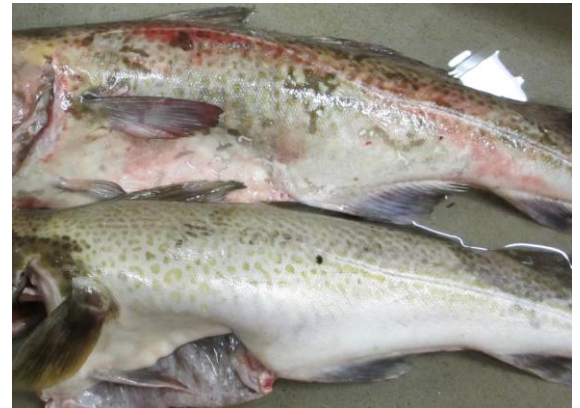
Bildet viser en sjødød torsk og en feilfri torsk