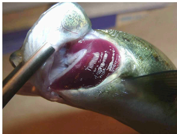
Illustrasjon 3: Fine gjeller.

Det brukes 10% formalinløsning (ca 4% aktivt stoff, dvs formaldehyd) til fiksering av gjelleprøver som klippes fra nettopp avlivet fisk. (Ferdiglaget buffret formalin kan gi noe bedre prøvemateriale.)