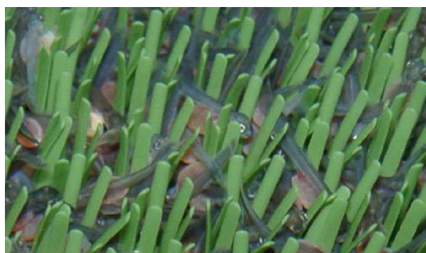
Illustrasjon 2: Plommeseckyngel trives i substrat.

Hvis startfôringen skjer for tidlig, kan det medføre tap av en stor andel yngel. Plommesekken skal som hovedregel være tom på de fleste individene før fôring kan startes. Gjennomsnittlig antall døgngrader fra klekking til startfôring har økt gradvis de siste 20 årene og de fleste smoltproducentene passerer i dag 900 døgngrader med god margin før oppstart av fôringen. Startfôringsyngel har andre behov enn en fisk i påvekstfasen (den har ingen fettreserver å tære på etter at plommesekken er oppbrukt). Det må tilstrebes at all startfôringsyngel får spise hver gang fôr tildeles. Isteden for "skvettfôring" fôres det ut færre måltid med mer mat. Rundt 20 sekunders utfôring og 240 sekunders pause kan ofte anbefales.