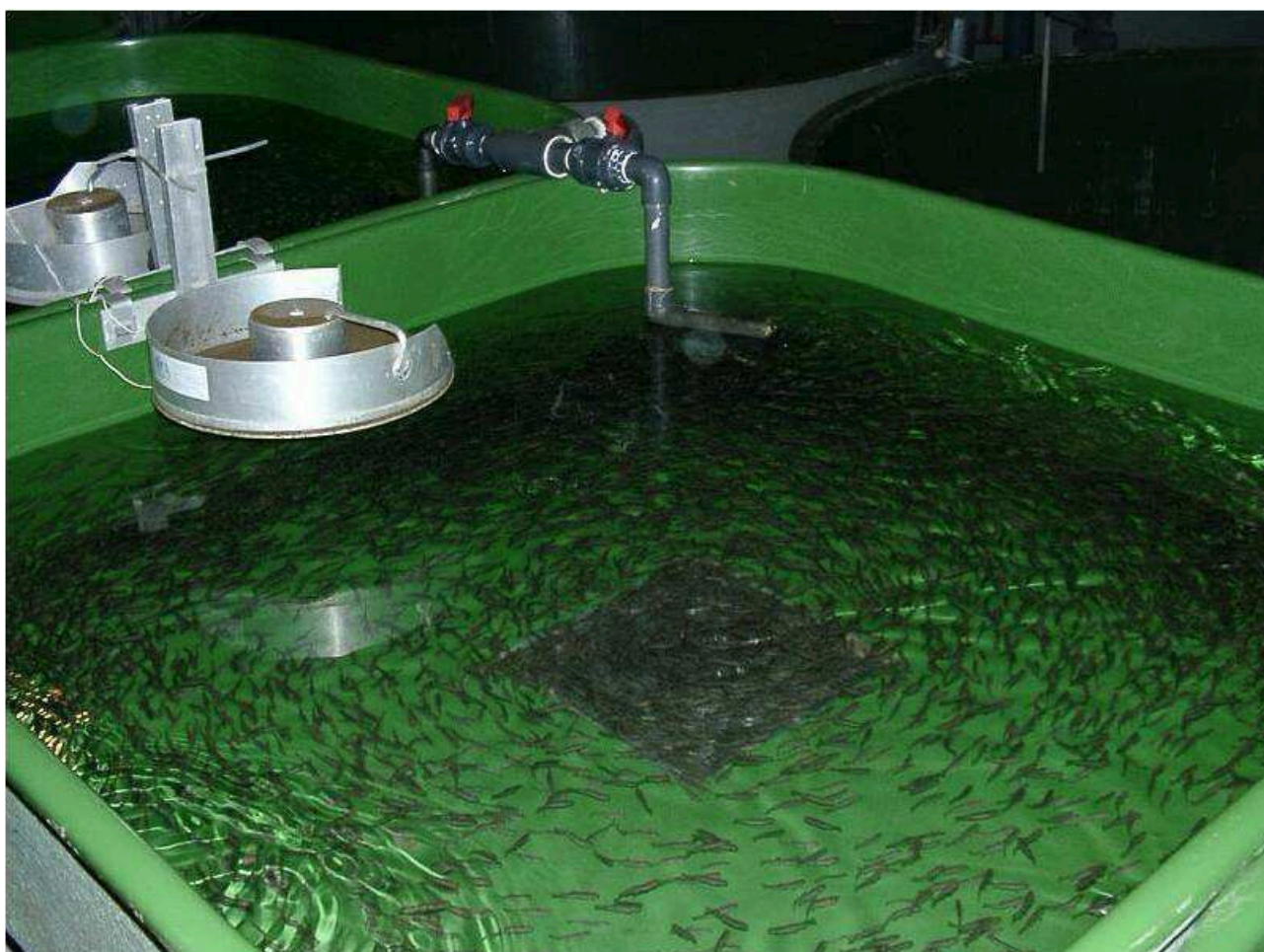
Illustrasjon 1: Fôring av yngel.