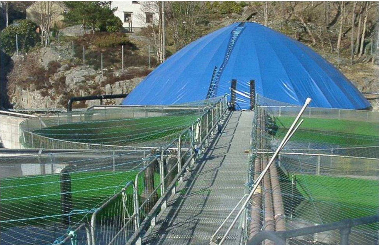
Illustrasjon 4: Uteavdeling i settefiskanlegg.

http://www.lovddata.no/cgi-wift/ldles?doc=/sf/sf/sf-20041222-1785.html#54