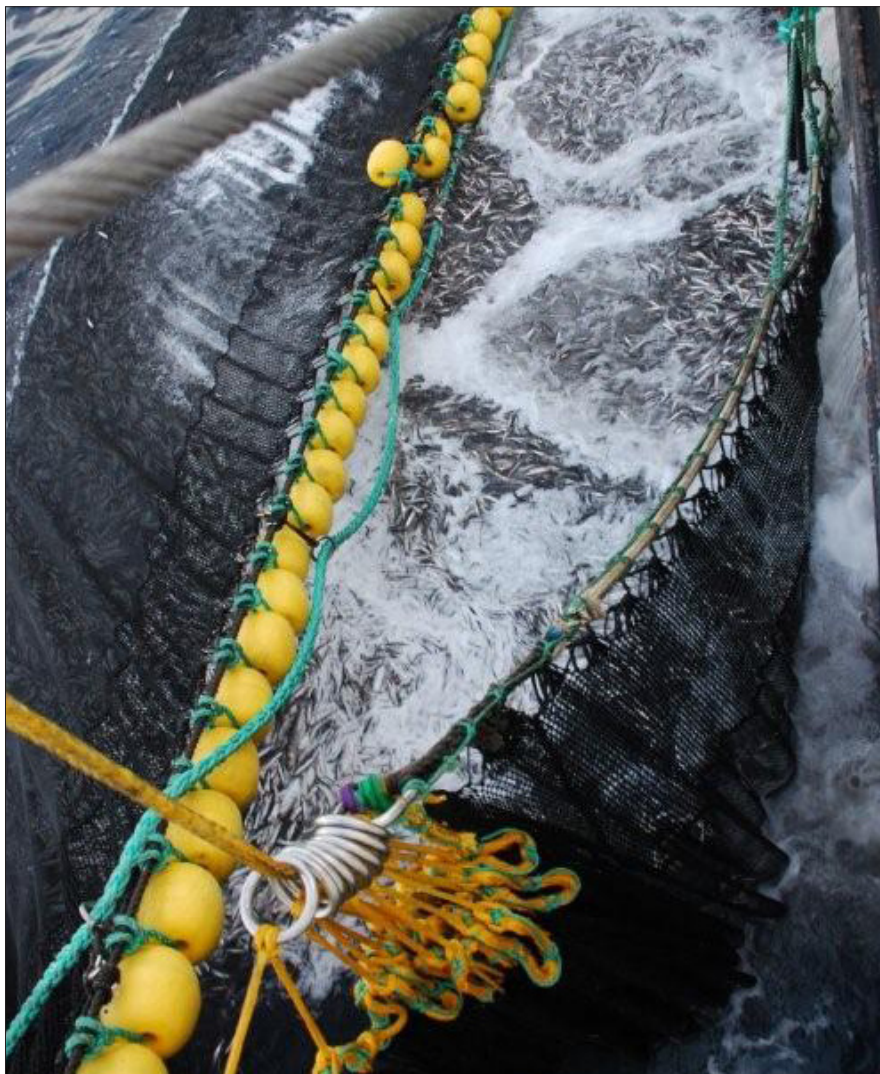
Loddekast ved skutesida, klar til pumping ombord.