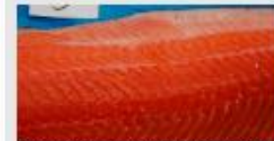
Score 0 – Fast fillet. Overflaten gjenoppvokster kort tid etter at fingertykket er pphøvet.