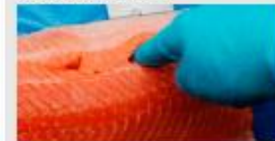
Score 2 – Bløtt fillet. Fingertykket svinger rett gjennom filleten og forårsaker tydelig blodmedlem segmen- tene.