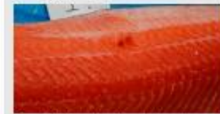
Score 1 – Raskt er dækket. Fingertykket vokster et sving stykk som ikke gjenoppvokster.