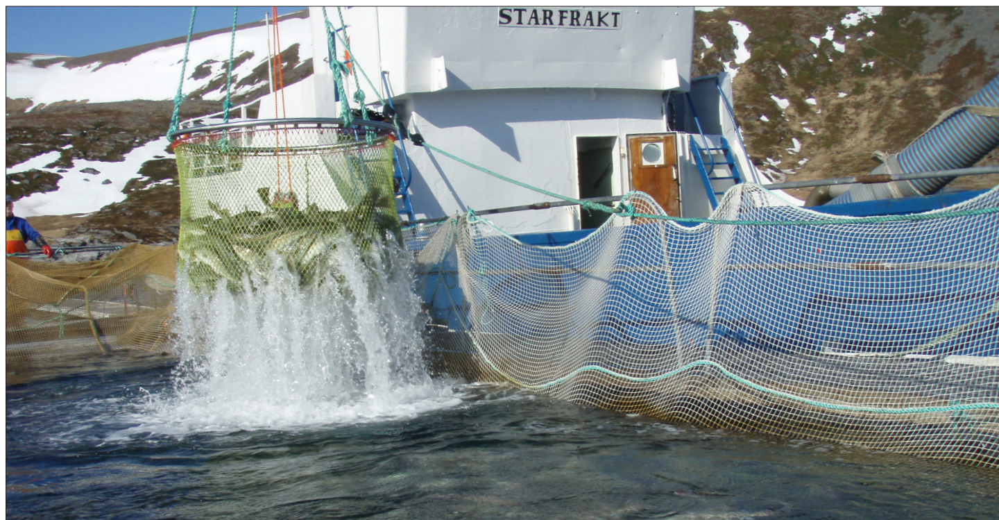
Håving av lagret torsk klar for salg.

Interessen for fangstbasert akvakultur har variert betydelig siden konseptet i sin nåværende form ble utviklet på slutten av 1980-tallet. Oppturene har spesielt vært knyttet til situasjoner med lav torsk kvote og høye priser. Nå står aktørene ovenfor kraftig økte kvoter og et prisfall på om lag 40 prosent – er konseptet fortsatt levedyktig?