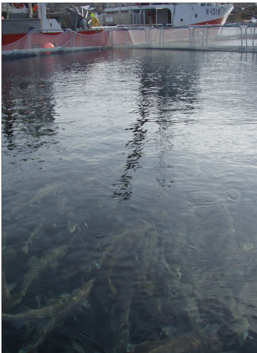
Levendefanget torsk i mottaksmerd.