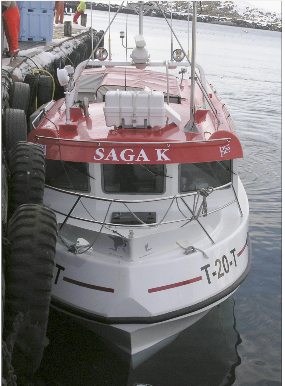
"Saga K", 10,95 m, utstyrt med Mustad Coastal autolinesystem med 13 000 krok.

Linefiske i Norge og Island har utviklet seg forskjellig. Fremveksten av små autolinefartøy på Island – mange av disse eid av fiskeindustrien – er en viktig forskjell. Da det i 2008 kom to slike fartøy til Norge, innledet Nofima Marked og Fiskerihøgskolen et samarbeid med et av rederiene