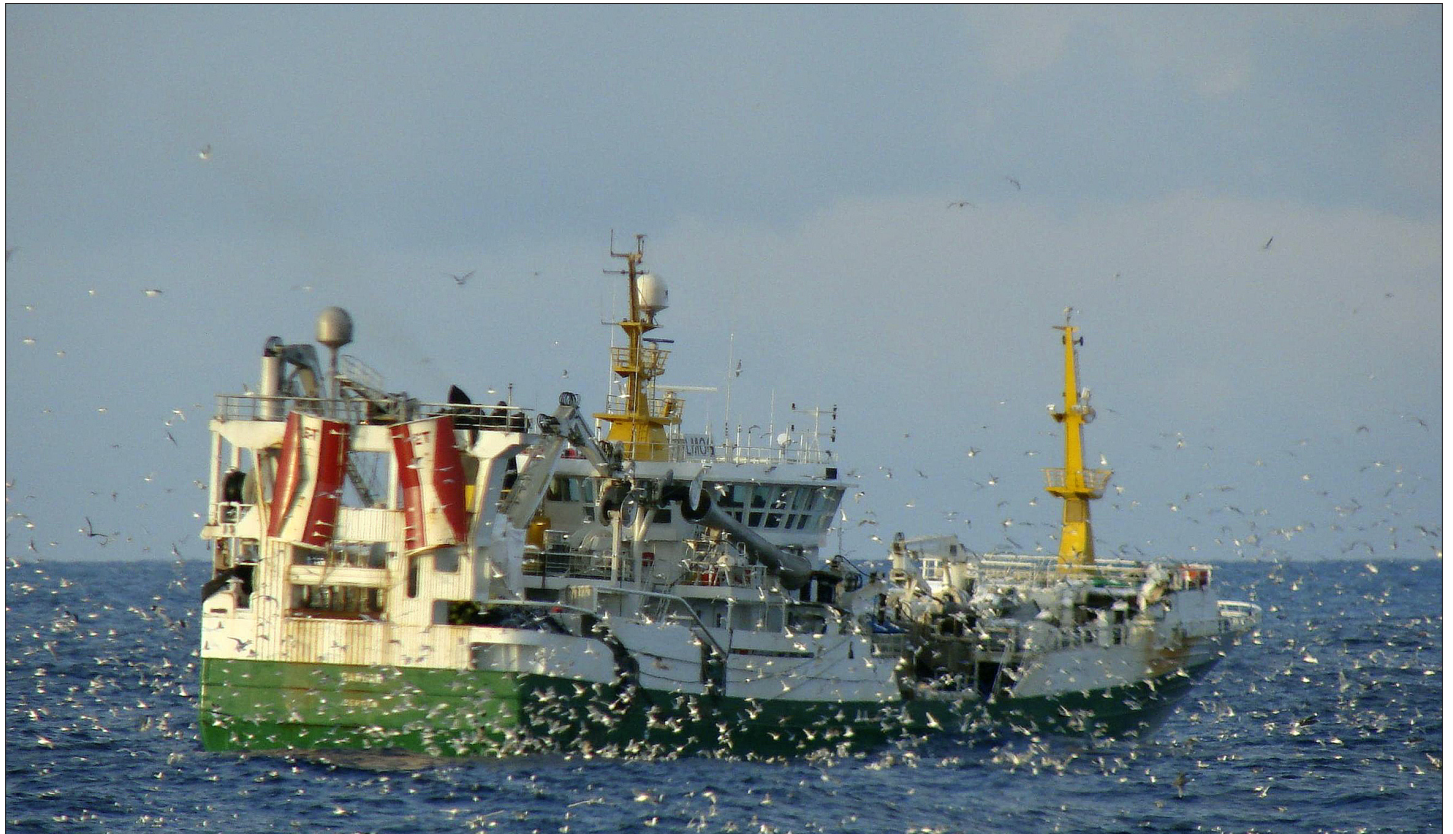
Ringnotsnurperen "Gardar" på loddefeltet. Den største delen av loddekvota fiskes med ringnot.

Lodda er en nøkkelbestand i økosystemet i Barentshavet, og inngår i dietten til både torsk, hyse, sild og sel. Loddebestandens størrelse kan variere mye som følge av beitepress og fiske, og siden lodda dør etter gyting. Samtidig har lodda stor fangstverdi og finner veien til mange godt betalende marked.