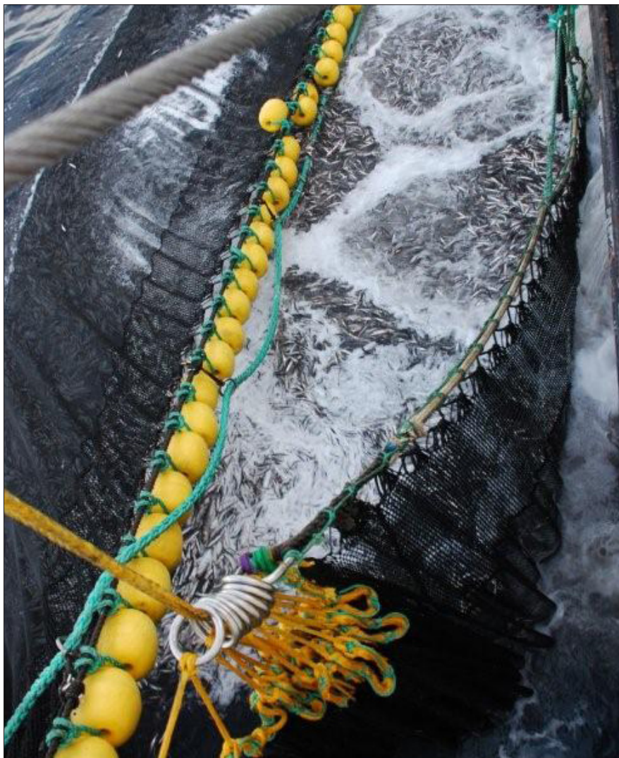
Loddekast ved skutesida, klar til pumping ombord.