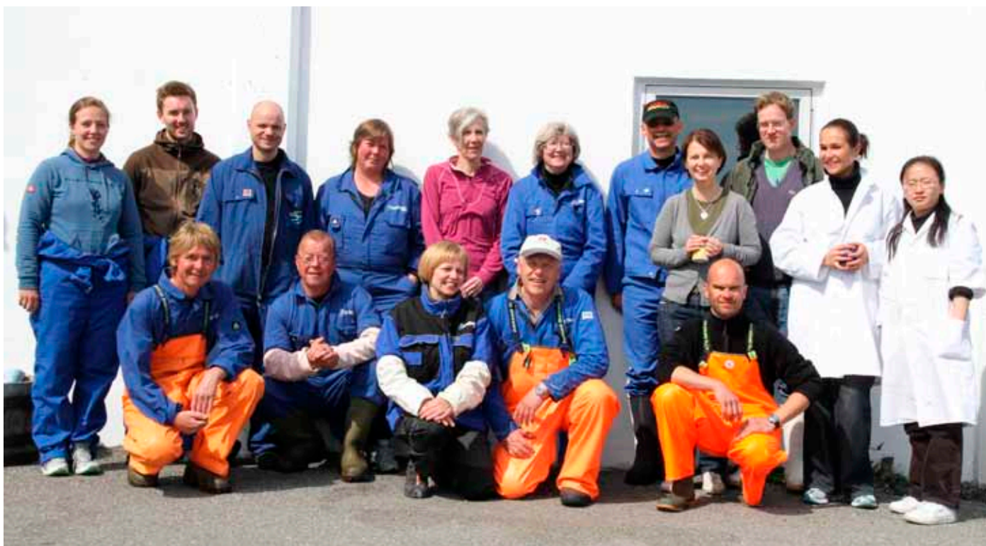
Mannskapet ved forsøkets avslutning i mai 2010.