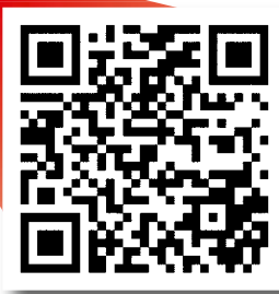
LAST NED NETTVERSJONEN HER