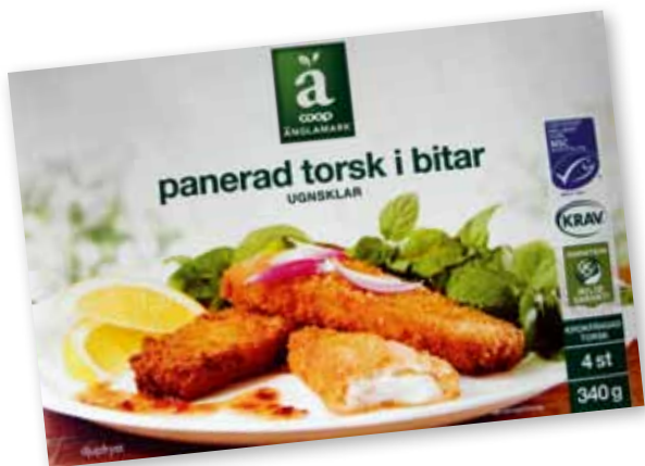
▲ Coop som har en sterk miljøprofil i det svenske markedet, særlig gjennom sitt eget merkenavn Coop Ånglamark.

også «smak», noe som indikerer at god smak er en viktig årsak til deres gjenkjøp. Tre av de åtte respondenterne oppga også merkevarerne Coop Ånglamark (2) og «Findus» (1), to oppga pris og to oppga kvalitet hvorav den ene sa «jeg likte kvaliteten og vet hva jeg kjøper».