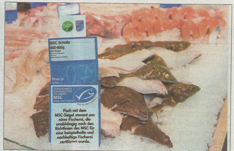
MILJØMERKE: MCS er et velkjent miljømerke for miljøbevisste forbrukere.