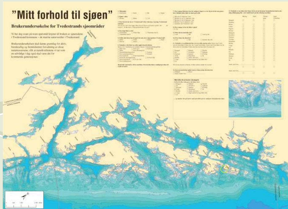
Spørreskjema for Tvedestrand