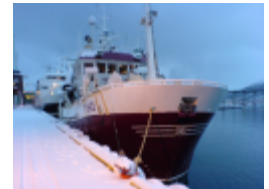
Kystnot ønskes som deltakere