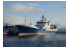
Ringnotfartøy ønskes som deltakere