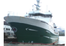
Trålere: ønskes som deltakere