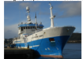
Autolinefartøy ønskes som deltakere