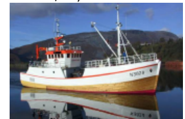
Kystfartøy under 22 meter ønskes som deltakere