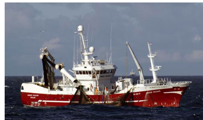
Inger Hildur er en av medlemsbåtene i Energinetverk Fiskeflåte

Norges Fiskarlag og Fiskeri- & Havbruksnæringens Forskningsfond