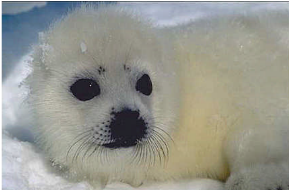
“A trail of a Puppy harp-seal blood”