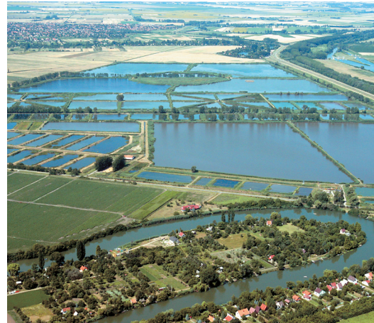
I disse dammene hos forskningsinstituttet HAKI (Research Institute for Fisheries, Aquaculture and Irrigation) i Ungarn ble karpene i forsøket holdt.