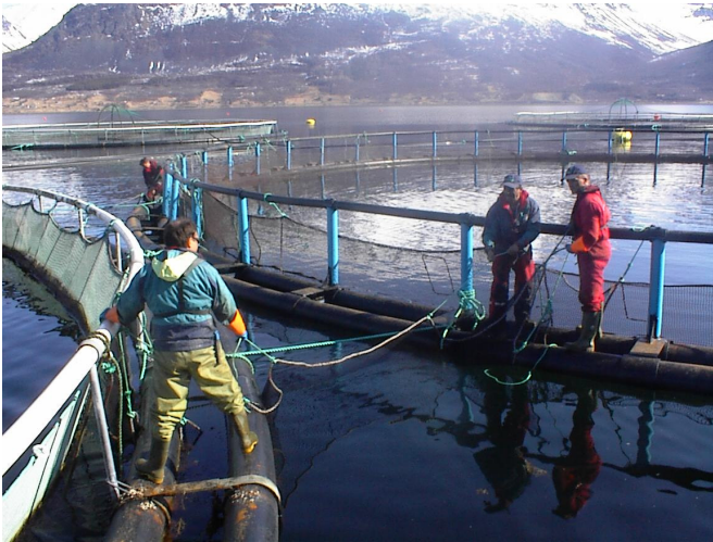
Bilde 2 Mellomstykket sikres med tau.