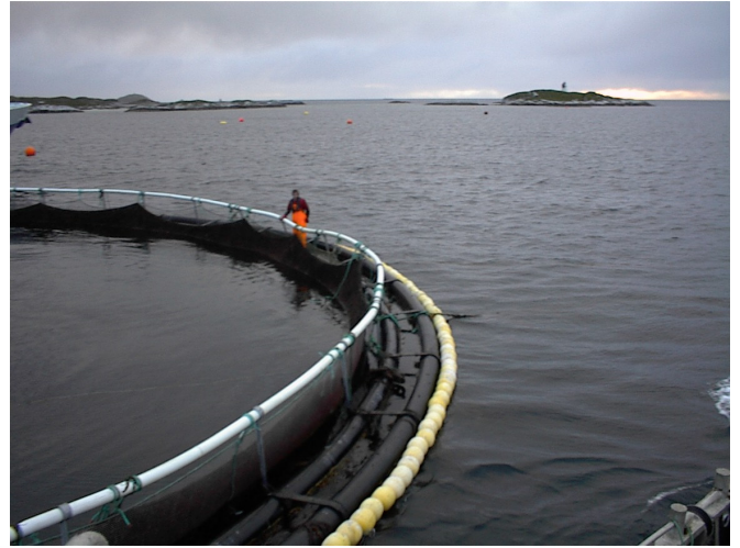
Bilde 3 Kulelina trees på utsida av gammel flytekrage.