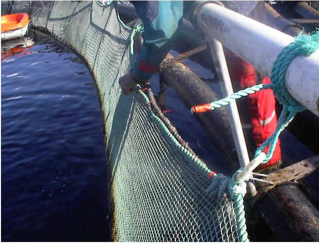
Bilde 1 Sammensyning av topptau og mellomstykke.