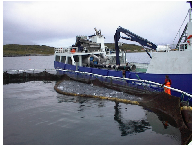
Bilde 4 Fortrenging av fisk med kuleline.