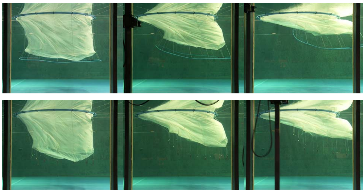
Bilde 7. Bildeserie av not med bunnring (øverst) og not med klumplodd (nederst) ved tre ulike strømhastigheter.