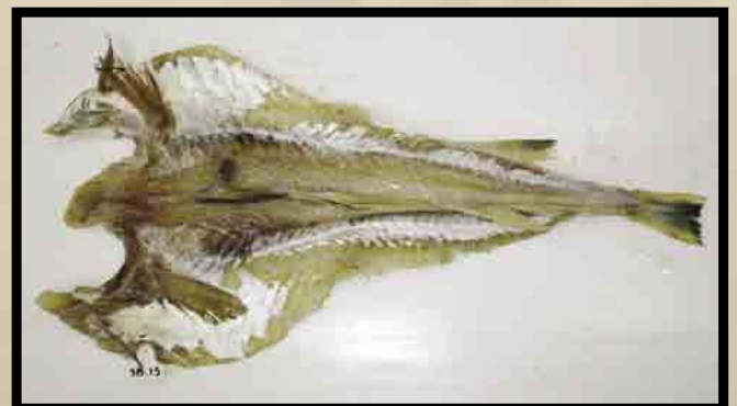
Redskapsmerket utvannet fisk uten skinn.