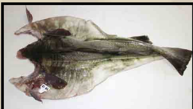
Skinnsiden av nyflekkt redskapsmerket fisk.