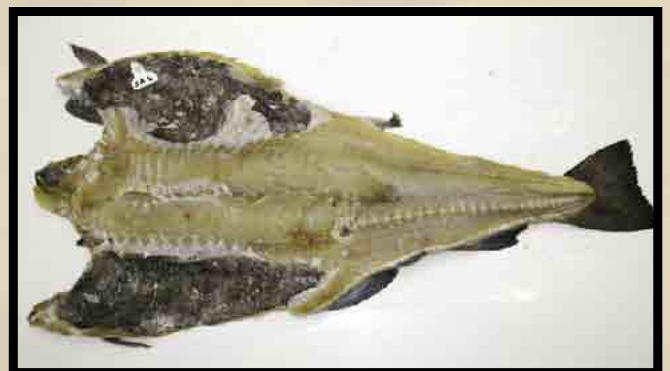
Utvannet blodsprengt fisk.