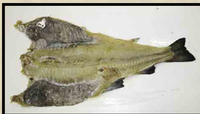
Sjødød utvannet fisk.