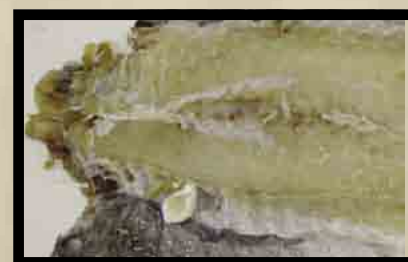
Bildene viser samme fisk fra kjøttssiden og skinnsiden etter at skinnen er fjernet. Skadene er ikke synlig fra kjøttssiden, men ligger under skinnen.