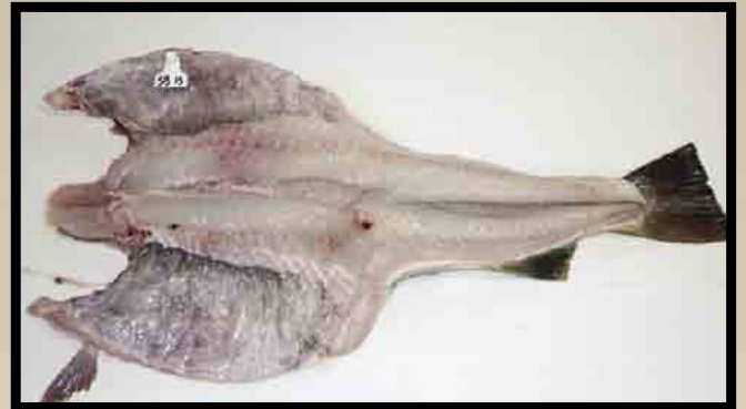
Redskapsmerket nyflekkt fisk.

Opptil 40 prosent av denne fisken ble vraket som sortido/universal av vraker som var oppmerksom på bloduttredelser under skinnet.