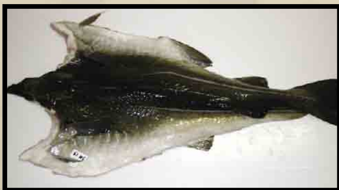
Skinnsiden av nyflekke feilfri fisk.