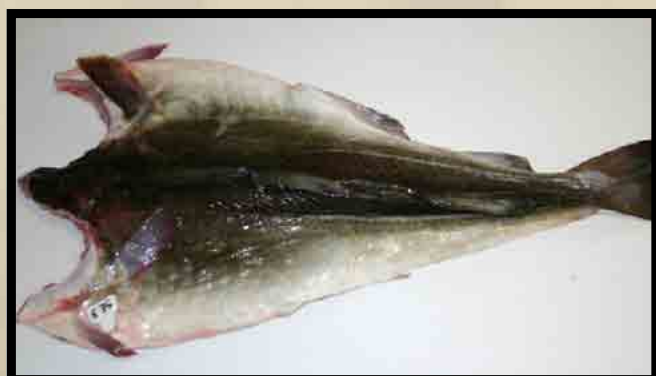
Skinnsiden av utvannet dårlig blodtappet fisk.