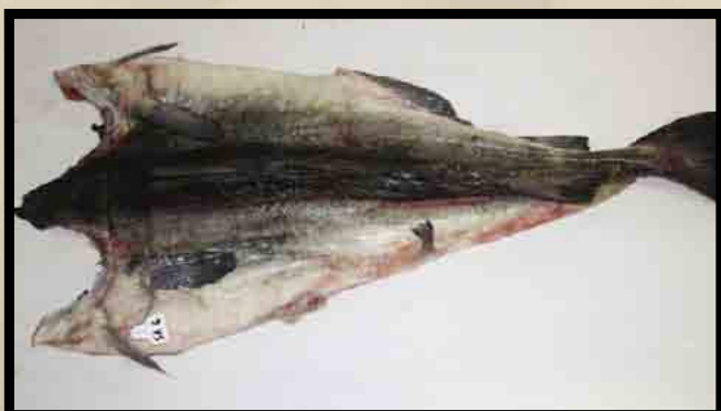
Skinnsiden av nyflekket blodsprengt fisk.