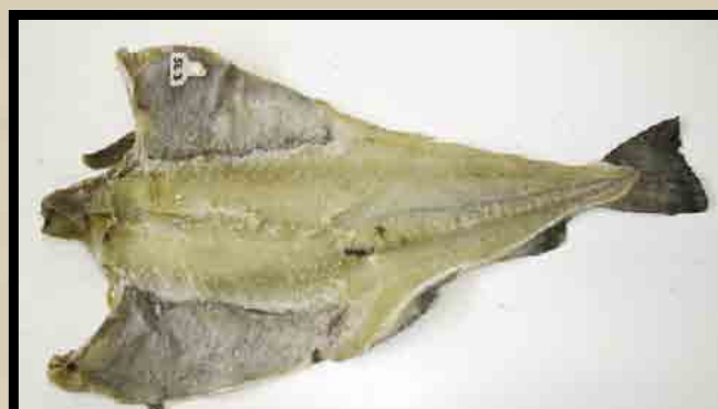
Dårlig blodtappet saltmoden fisk.