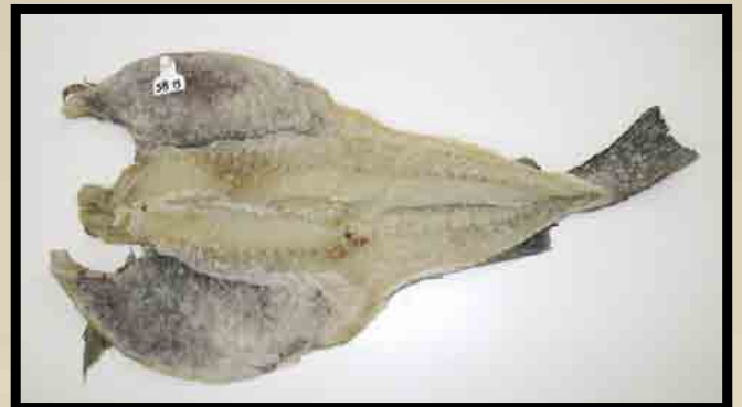
Redskapsmerket saltmoden fisk.