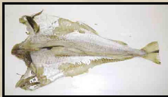
Dårlig blodtappet utvannet fisk uten skinn.