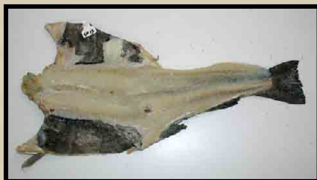
Saltmoden feilfri fisk.