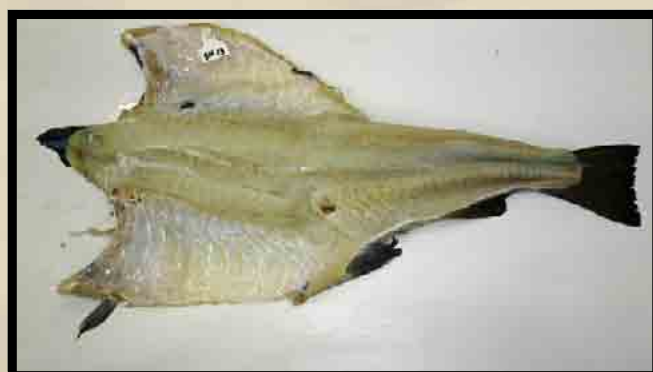
Utvannet feilfri fisk.