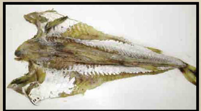
Utvannet blodsprengt fisk uten skinn.