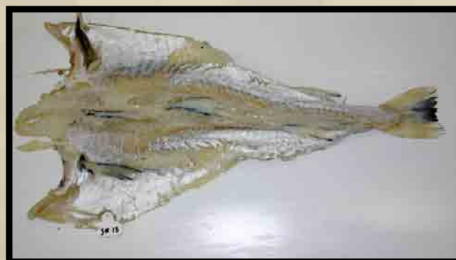
Utvannet feilfri fisk uten skinn.