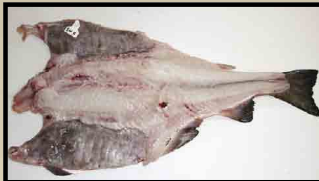
Sjødød nyflekkt fisk.

Etter fjerning av skinnet kom flere blodfeil til syne. Nesten all fisk i denne kategorien ble vraket som sortido/universal.