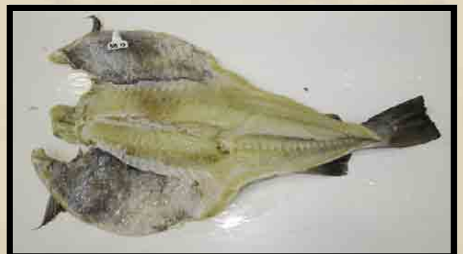
Redskapsmerket utvannet fisk.