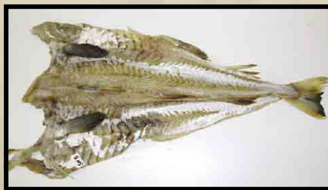
Sjødød utvannet fisk uten skinn.