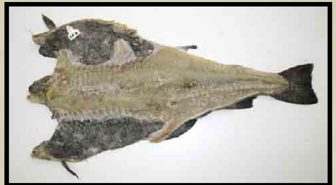
Saltmoden blodsprengt fisk.