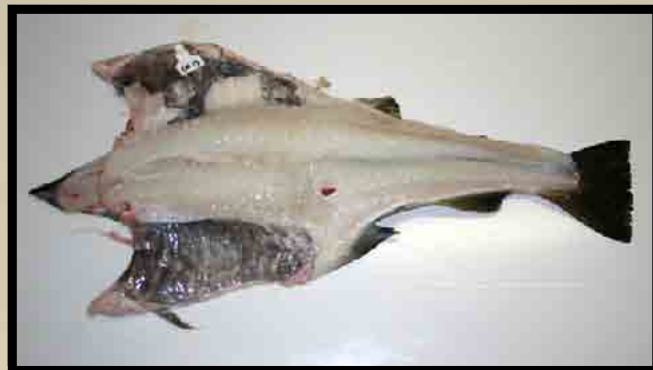
Nyflekke feilfri fisk.

Ved vraking på bedriftene ble så godt som all saltfisk vurdert som primeira/superior.