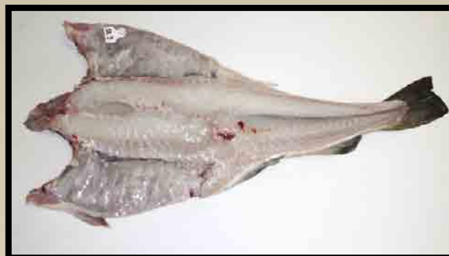
Dårlig blodtappet nyflekke fisk.

Vrakingen av saltfisk viste at opptil 35 prosent av fisken ble sortert ut som sortido/universal.