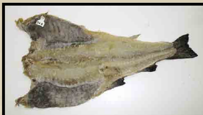
Sjødød saltmoden fisk.