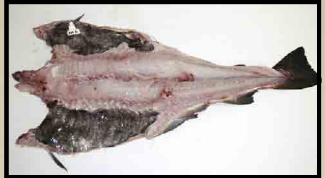
Nyflekket blodsprengt fisk.

Vrakere som er oppmerksom på bloduttredelser under skinnen vurderte 90 prosent til sortido/universal.