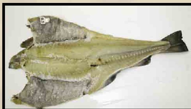
Dårlig blodtappet utvannet fisk.