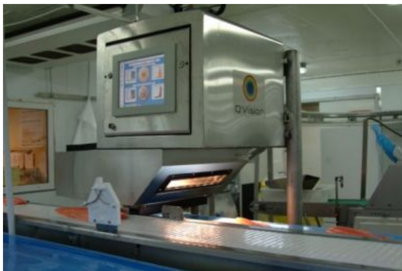
Bildet over viser QVision

Instrumentene som er brukt i disse undersøkelsene ble utviklet i tidligere samarbeidsprosjekter mellom de tre selskapene og er nå under produksjon av QVision. Både NIR QPoint punktmålersystem som i dette prosjektet har blitt brukt til kjernetemperaturmålinger og NIR QMonitor online skanner som har blitt brukt til å estimere isfraksjon baserer seg på interaktansmålinger; lys sendes inn og mottas på overflaten av produktet, men man måler kun lys som har vært transmittert et stykke ned i produktet. Med QVision systemene kan man måle ca 2 cm inn i produktet i motsetning til mange av de eksisterende online NIR systemene som baserer seg på rene overflatemålinger. Dette åpner muligheten for temperaturmålinger som er representative for hele dybden, eller kjernen av mindre produkter som kjøttkaker, hamburgere, fiskefileter etc. Målingene kan gjøres på få sekunder uten kontakt og produktene kan brukes videre i prosessen.