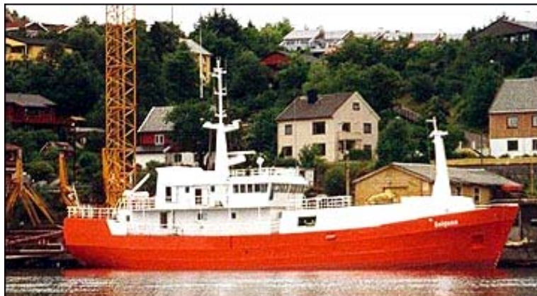
Figur 5: Sandwichoverbygg til fiskebåten MS Solgunn

Figur 5 viser et sandwichoverbygg på fiskebåten M/S Solgunn (60 meter langt stålfartøy). I dette tilfellet ga bruk av sandwich en vektbesparelse på rundt 50 %. Overbygget er på to etasjer, 10-12 meter langt og 5 meter bredt. Det ble installert i forbindelse med en ombygging av båten. Silverplast AS utførte arbeidet med overbygget.