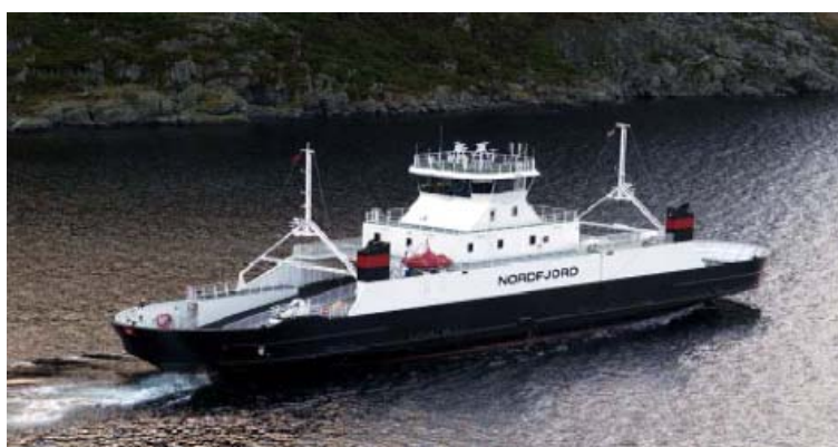
Figur 6: Sandwichoverbygg til kystfergen MS Nordfjord

Figur 6 viser fergen MS Nordfjord med et overbygg i sandwich. Overbygget ble laget av Norwegian Marine AS i Eikefjord. Skroget er 72 meter langt og laget i stål. Eieren er rederiet Fylkesbåtane i Sogn og Fjordane (FSF). I følge rederiet ble overbygget i sandwich hele 30 tonn lettere enn andre alternativer, ned fra 45 til 15 tonn. Fordi kjernematerialet som benyttes i sandwich har meget gode isolerende egenskaper, slapp man også å etterisolere innredningen.