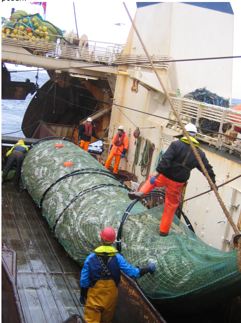
Bilde 1. Et bra hal med kun stor torsk.

fangstmengdesensorene som tiltenkt når fisken ikke transporteres fortløpende bak i posen.