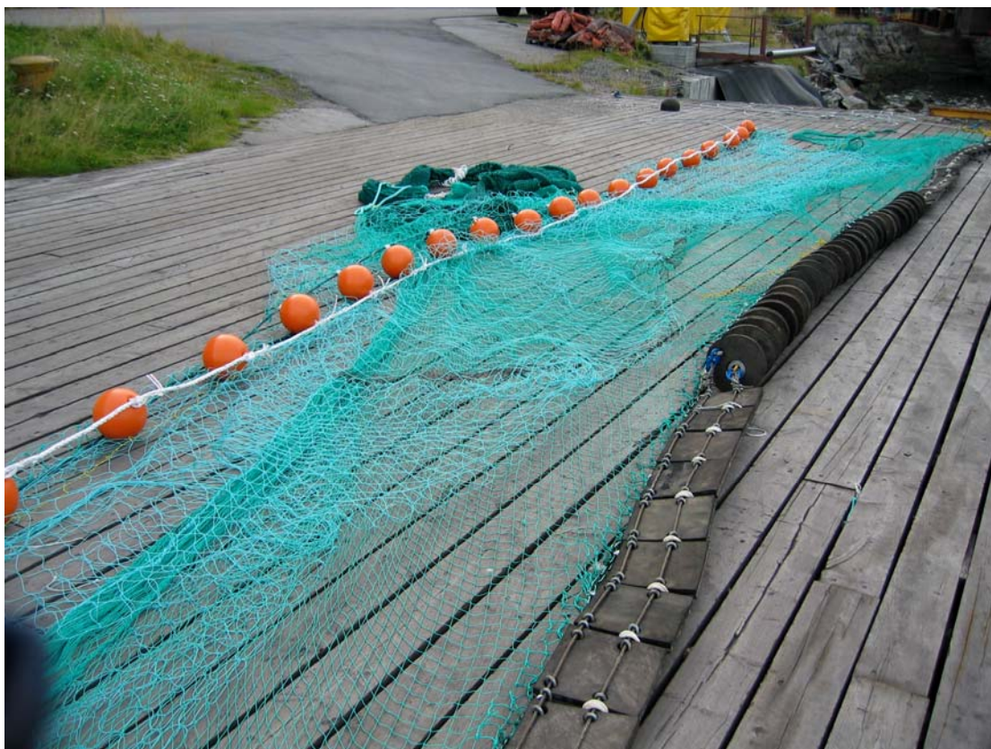
Figur 3. 1:2 trålmodellen montert med kombinert plate og rockhopperskiver