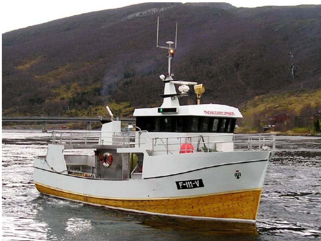
Bilde 2 Fartøyet etter ombygging i 2005.

Onsdag 9. november 2006 reiste to forskere fra SINTEF Fiskeri og havbruk til Vardø for å besiktige båten og foreta feltmålinger (på torsdag), for deretter å analysere sjøegenskapene.