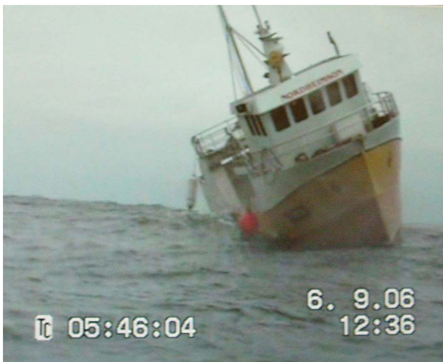
Bilde 3 Skjermbilde fra filmen tatt utenfor Vardø. Båten har store rullebevegelser i moderat sjø.

Fartøyets bevegelser er videofilmet av Bjørn Steinar Nordheim. Etter studie av denne filmen fremkommer det at fartøyet får store rullebevegelser i noe som på filmen ser ut som rolig/moderat sjø. Denne videoen er med å bekrefte de teoretiske vurderingene SINTEF Fiskeri og havbruk har gjort av fartøyet.