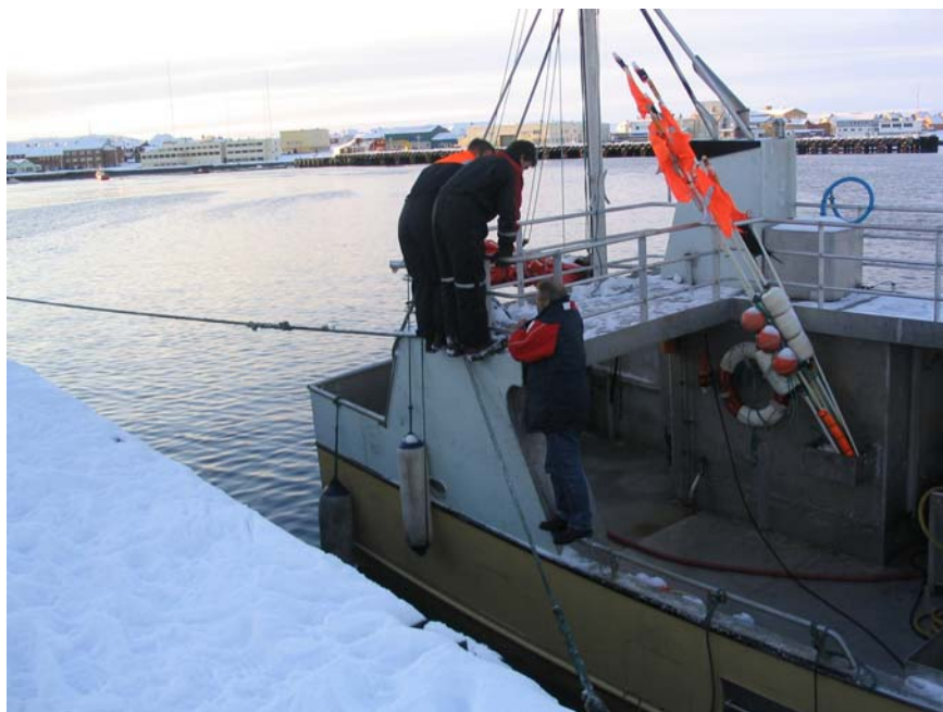
Bilde 4 Måling av egenrulleperiode i Vardø havn.

Fartøyets bevegelser ble målt med et inklinometer, som måler vinkelutslag i rull og stamp.