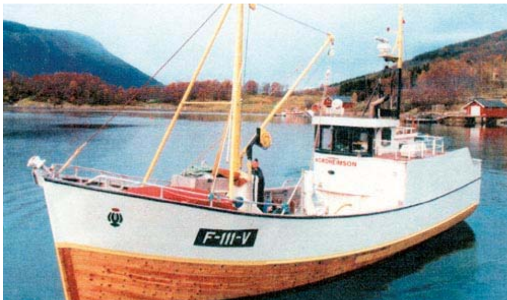
Bilde 1 Fartøyet før ombygging. Foto Shipping Publications AS.

I september 2006 tok reder og skipper Bjørn Steinar Nordheim kontakt med Norges Fiskarlag og SINTEF Fiskeri og havbruk for å få hjelp til å gjøre en vurdering om noe kunne gjøres for å forbedre båtens dårlige sjøegenskaper. SINTEF Fiskeri og havbruk fikk så avklart med Norges Fiskarlag om finansiering av et prosjekt for å avdekke årsaker til de dårlige sjøegenskapene samt foreslå mulige forbedringstiltak.