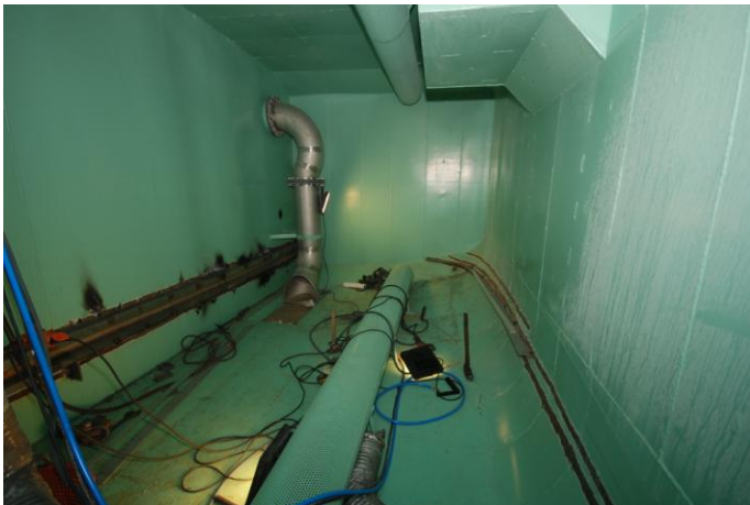
Figur 2. Montering av skinner for feste av dobbelbunn i babord siderom. Det runde røret midt i rommet gir tilførsel av friskt vann under dobbelbunnen, og RSW-vann under føring av pelagisk fisk (kalles ofte for ”sigar”).

Figur 3 viser babord siderom med ferdig montert dobbelbunn. Rommet fremstår som et ideelt forsøksrom med lite utspring og andre detaljer som kan virke forstyrrende på fiskens oppførsel og trivsel. Etter at bildene er tatt, er pumpekassen på Figur 4 blitt utstyrt med et hengslet lokk som stenger pumpekassen under transport av levende fisk. Tidligere forsøk har vist at torsken søker ned mot rommets dypeste punkt, og i dette tilfelle vil det være pumpekassen. Når torsken først har kommet ned i pumpekassen vil den uvilkårige søke opp i pumperøret hvor det ikke er utskifting av vann, og man vil få en utilsiktet dødelighet.