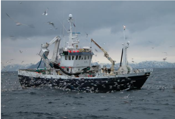
M/S "Trinto" i fiske utenfor Hjelmsoya i 2005 (gammel versjon).

M/S "Trinto" ble ombygd i perioden fra ultimo september 2006 til september 2007. Et strengt arbeidsmarked, samt "byggeboom" forsinket prosjektet med mange måneder. Det endelige resultatet er imidlertid blitt svært bra. Slik som fartøyet som fremstår pr i dag, vil det bli en svært god arbeidsplattform for fremtidige FoU- oppgaver innen fangstbasert havbruk og redskapsforskning. Figur 1a og b viser "gamle og nye" M/S "Trinto". Som det går fram av bildematerialet, ble det totalt sett en omfattende ombygging, både med hensyn til skrog, dekkarrangement, samt overbygg.