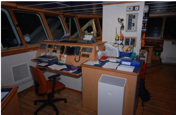
Figur 14. Rorhusets kommunikasjonsavdeling.