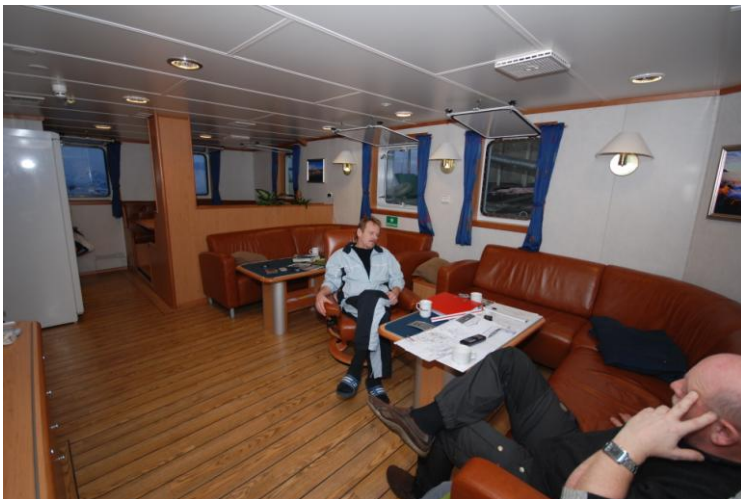
Figur 11. Oppholdsrom med spisekrok i bakgrunn.

Totalt sett må boforholdene anses som meget gode.