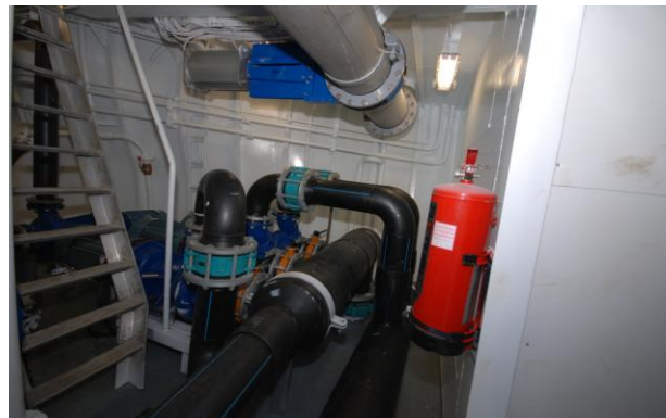
Figur 7. Sjøvannspumper med ND 250 samlestock.