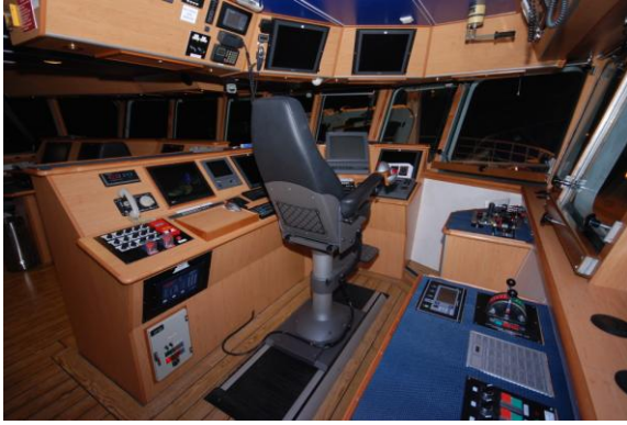
Figur 12. Rorhuset manøvreringsavdeling.