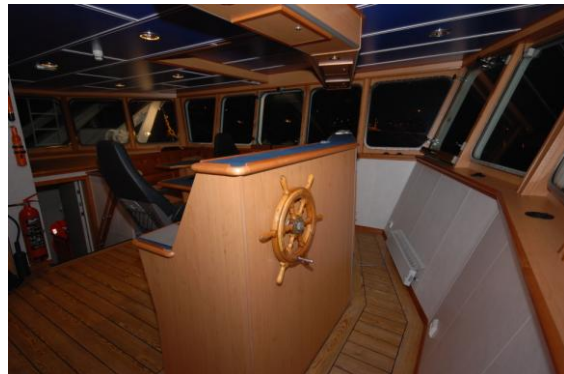
Figur 15. Konsoll trukket tilbake fra rorhus front.