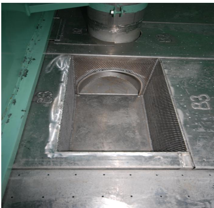
Figur 3b. Pumpekasse for levende torsk.