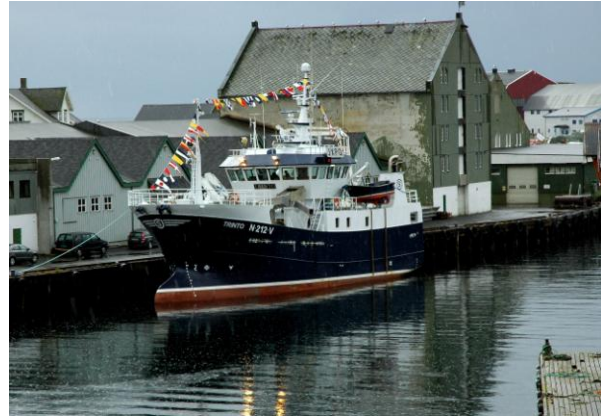
Nye M/S "Trinto" ved kai i Svolvær etter ombygging og hjemkomst i 2007.

Kort tid etter at M/S "Trinto" ankom Blaalid A/S ved Måløy, ble det startet arbeidet med å definere utstyr nødvendig for fremtidig FoU-virksomhet på økt føringskapasitet av levende torsk. FoU-relatert utstyr som ble vurdert montert om bord i fartøyet, var av en slik karakter som strengt tatt ikke var nødvendig i et vanlig kommersielt fiske.