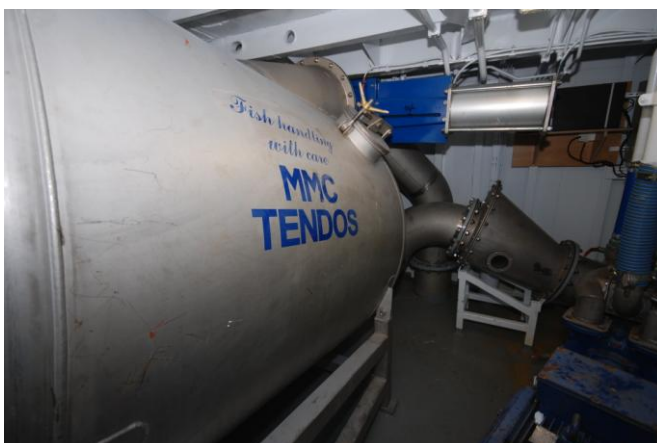
Figur 9. Vakuum-tank samt forkammer for pumping av levende fisk.

For å kunne losse levende fisk på en forsvarlig måte ble det besluttet å montere et 14" vakuum anlegg. Dette anlegget ville være viktig i FoU-virksomhet med fokus på økt føringskapasitet og lossing av levende torsk på en skånsom og forsvarlig måte. Med hensyn til fremtidige forsøk med forflytning og røkting av føringsrom om bord, og ikke minst med hensyn til å finne optimale og skånsomme verdier på vakuum som kan benyttes uten at fisk med lukket svømmeblære tar skade, ville et godt dimensjonert vakuumanlegg, tilpasset pumping av levende fisk, være helt nødvendig.