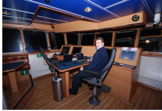
Figur 13. Konsoll med to arbeidsstasjoner for PC, samt tre (fire) videoskjermer . Liten sofakrok kan sees til venstre.