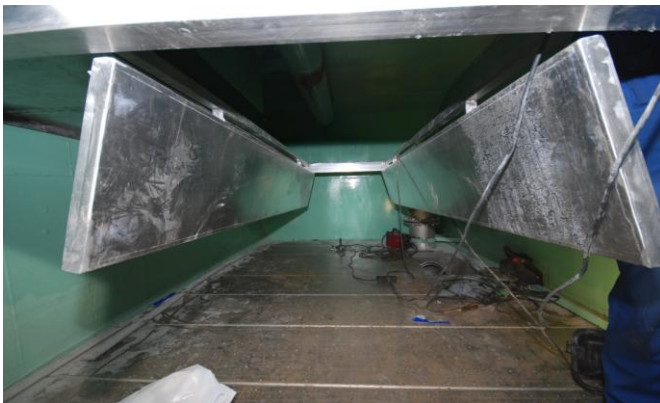
Figur 5. Hengslet luke for etasjebunn.