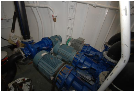
Figur 6. Sjøvannspumper for levendefangst. I bakgrunn frekvensregulert pumpe for RSW- og/eller sjøvann.

M/S "Trinto" er utstyrt med tre stykker frekvensregulerte sjøvannspumper som hver leverer 330m 3 vann i timen. I tillegg kan RSW-pumpen på 330 m 3 benyttes. Figur 6 viser de tre pumpene som er beregnet benyttet under levendefangst.