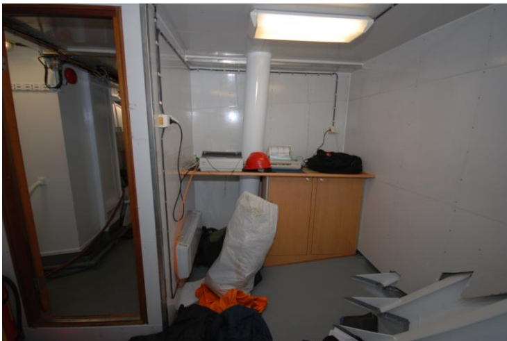
Figur 16. Kombinert våt- og tørrlab.

Framme under bakk er det avsatt plass til et kombinert tørr- og våtlaboratorium (Figur 16). En slik fasilitet finnes knapt i fartøygruppen opptil 28- meter. Rommet vil være svært anvendelig i en hver FoU-sammenheng.