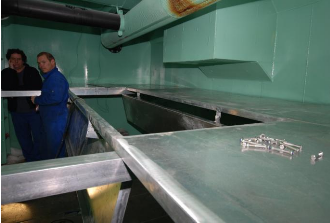
Figur 4. Etasjebunn under montering i styrbord rom.

lossing av fangst slippes lemmene ned og torsk i det øvre rommet vil søke ned i underetasjen med pumpekasse.