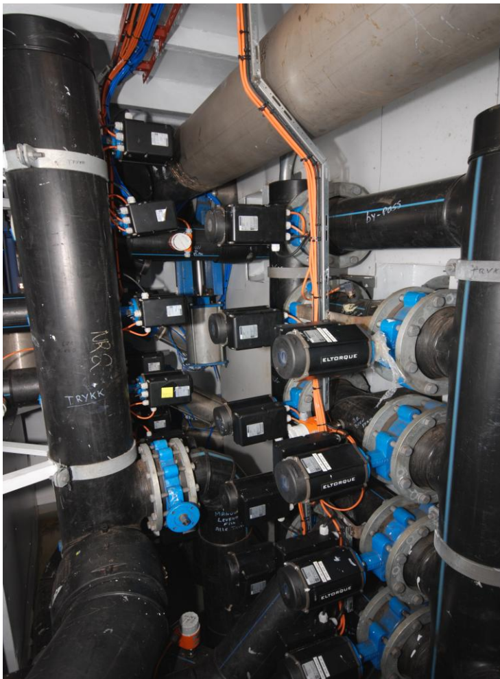
Figur 10. Bilde fra en del av pumperommet. De orange og grå boksene montert på tilførselsrørene til rommene er flowmetre. De svarte horisontalliggende boksene i forgrunnen er aktuatorer som stenger og åpner vanntilførsel til føringsrommene (via fjernstyring fra touchpaneler).

Fartøyet ville få et relativt omfattende og innviklet pumpe-, vannbehandlings- og fordelingsystem. Det ble derfor besluttet å lage et eget pumperom hvor en kunne samle alle fordelingsrør med tilhørende ventiler på en plass, både med hensyn til oversikt, men kanskje mest på grunn av plasshensyn (Figur 10). Pumperommet er plassert midt mellom de to fremste føringsrommene. Uten FoU-utstyr ville Trinto kunne ha hatt seks føringsrom istedenfor som nå, fem rom pluss pumperom.