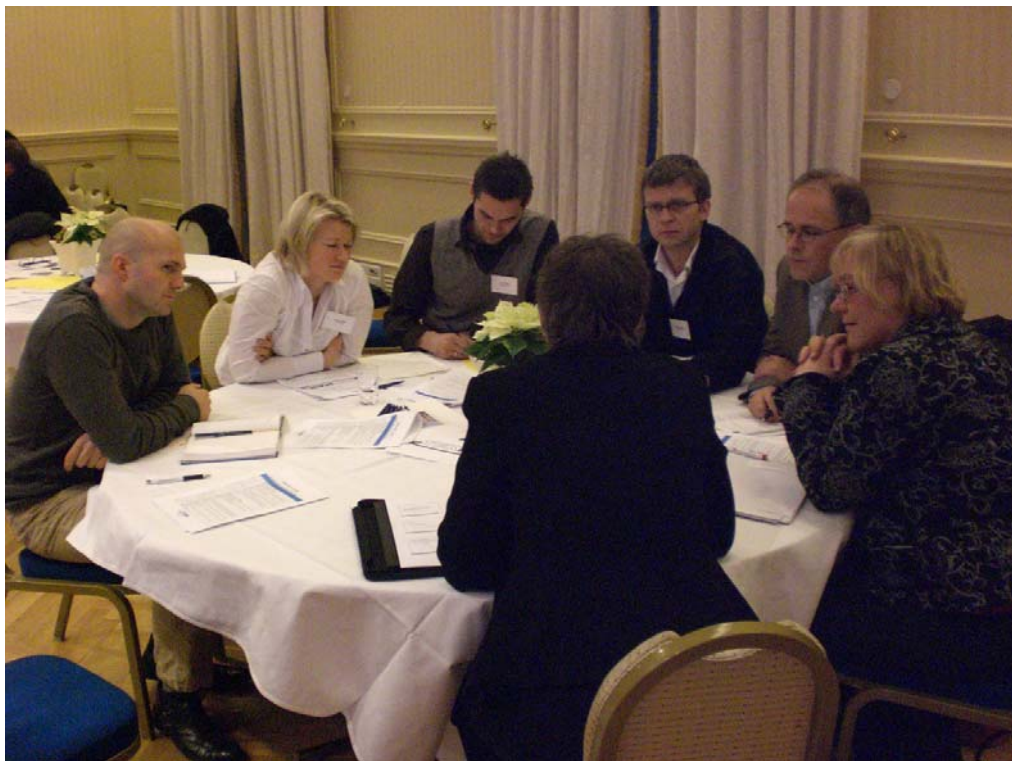
Figur 3. Klassiske rundebord diskusjoner og gullappseanser frambrakte mange gode innspill.